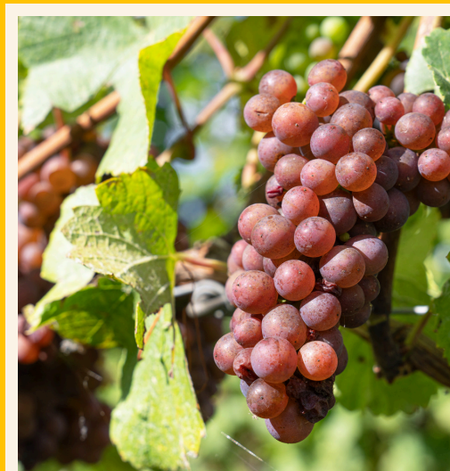
EXTRACTO DE SEMILLA DE UVA 95%